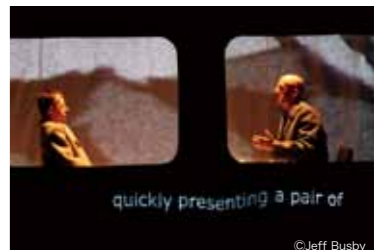
quickly presenting a pair of

バック・トゥ・バック・シアターは、実際に知的障がいを持つ俳優たちと共に設立された劇団。映像や照明を巧みに使ったイメージ豊かな空間づくりや、生命や美の基準をめぐる哲学的なテーマ設定でも知られている。中でもファンタジーの世界と現実とを同時に見通し、よりいっそう豊かな演劇空間へと昇華させた本作は、これまでに計7カ国上演された話題作。そのアジア初演をぜひ目撃しておこう。