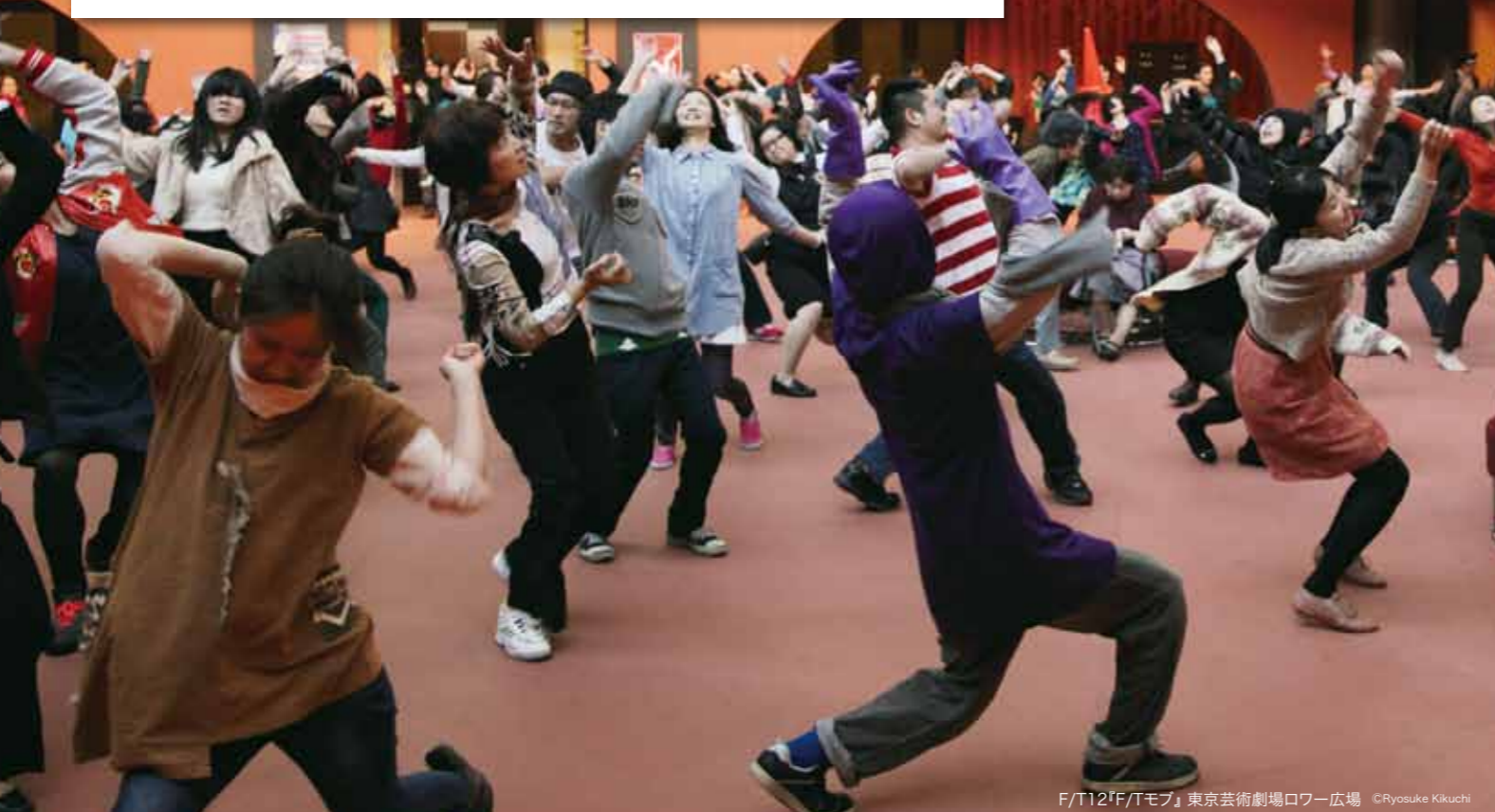
F/T12「F/Tモブ」東京芸術劇場ロワー広場 ©Ryosuke Kikuchi