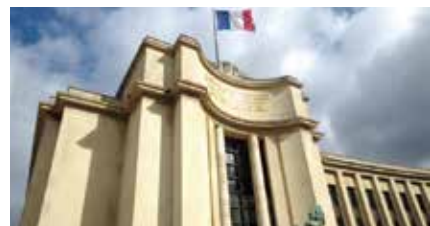
国立シャイヨー劇場(パリ)

製作：東京芸術劇場(公益財団法人 東京都歴史文化財団)/NODA-MAP 助成：平成26年度文化庁国際芸術交流支援事業 オフィシャル・エアライン：全日本空輸株式会社