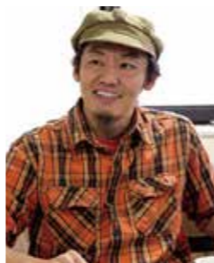
取材・構成: 乗越たかお (作家・ヤサクレ舞踊評論家)

大きさではない、だけどとても大切なもの……そんなダンスの本質が楽しめる公演になりそうだ。