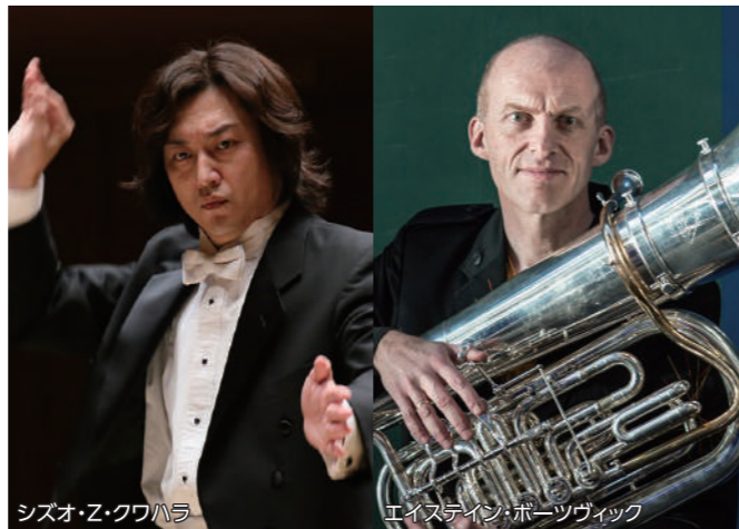
シズオ・Z・クワハラ エイステイン・ポーツヴィック

指揮者シズオ・Z・クワハラによる事前レクチャー 1月28日(日) 19:00～ シンフォニースペース(5階) エイステイン・ポーツヴィック テューバ・ワークショップ 2月28日(水) 19:00～ シンフォニースペース(5階) 詳細・お申し込みはHPへ