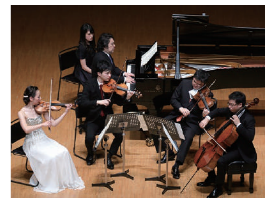
過去の芸術ランチコンサートの様子

2016年4月より、毎偶数月に開催してきた人気公演「芸術ランチコンサート~清水和音の名曲ラウンジ~」。ピアニストの清水和音を中心に、在京プロオーケストラの首席奏者や日本音楽コンクールの優勝者などが集まった“アンサンブル・サンセリテ”による、本格的な室内楽コンサートだ。アンサンブルならではの親密な空気はなか、一流の演奏家たちの音色で“耳馴染みのある名曲”を味わえる、クラシック初心者にもぴったりのシリーズである。回ごとに作曲家や楽器に焦点を当てたテーマも魅力で、3年目となる2018年度も心躍るプログラムが並ぶ。4月は「やっぱりモーツァルトが好き!」と題し、東武東上線池袋駅の発着メロディとしておなじみの《ディヴェルティメント 二長調》、《アイネ・クライネ・ナハトムジーク》をはじめとしたモーツァルトの超有名曲を取り上げる。そして8月のテーマは「愛しきヴァイオリン」。J.S.バッハの無伴奏ヴァイオリン曲《シャコンヌ》、20世紀最高のヴァイオリニストと言われるクライスラー作曲の《愛の悲しみ》《愛の喜び》などの名曲が並び、