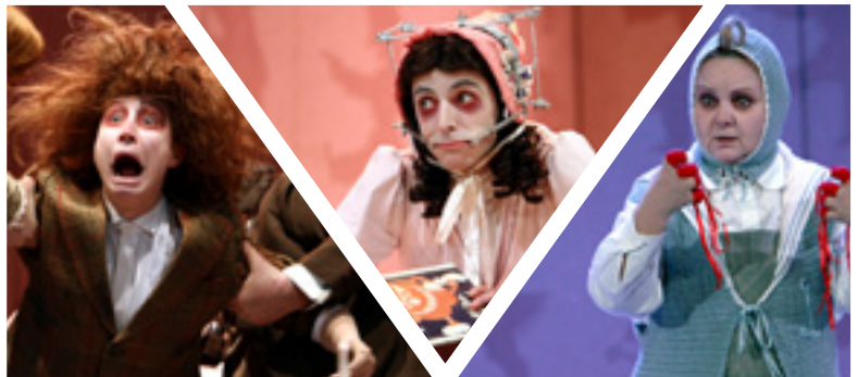
『ショックヘッド・ピーター』舞台写真: Eszter Gordon

もじゃもじゃペーターは、髪の毛も爪も切らないままのびっぴなし。みんなからからかわれて…?! ヘンリエットはダメだといわれていたマッチの火遊びをしてしまい…! おやゆびしゃぶりのコンラッド。ママがダメだといっていたのに、ゆびしゃぶりをやめられない。するとハサミを持った仕立て屋が現れた…!