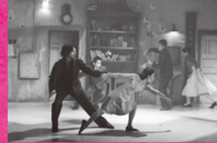
2008年上演「空白に落ちた男」 作・演出:小野寺修二 出演:首藤康之ほか