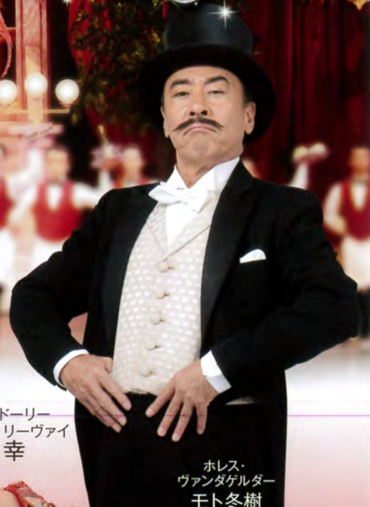
ミス・ドーリー ギャラガー リーヴァイ 剣 幸