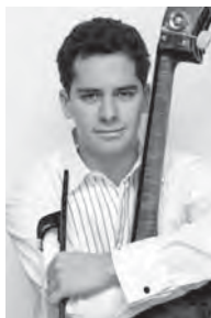
エディクソン・ルイス

今年から高校英語教科書「ユニコーン」(文英堂)には、エル・システムが題材として取り上げられています。その中に実名で登場するエディクソン・ルイスは、世界のトップオーケストラのひとつ、ベルリン・フィルに史上最年少で入団したコントラバス奏者。今回の来日に合わせ、彼本人が教科書を学ぶ高校生と英語でコミュニケーションを図ります。ルイスからは素敵なプレゼントも...。教科書の学びと現実体験が結びつく、教育的意義の深いワークショップ。