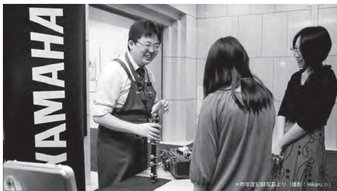
*昨年度記録写真より**