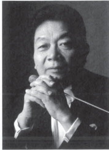
写真 第99回定期演奏会 2014年1月26日 於東京オペラシティコンサートホール

東京大学の学生によって構成されるオーケストラ。1920年の発足以来、ベートーヴェン交響曲第4番の日本初演、マーラー交響曲第1番「巨人」の学生初演、ヨーロッパへの演奏旅行など多彩な演奏活動を続けてきた。また、NHK交響楽団の前身、新交響楽団の創立者である近衛秀麿氏、当団名誉指揮者である早川正昭氏など多数の音楽家を輩出している。現在は、三石精一氏を終身正指揮者として迎え、夏のサマーコンサートと冬の定期演奏会を活動の中心とする一方、学園祭での演奏会、小中学生を対象とした音楽教室など、さまざまな音楽活動を行っている。