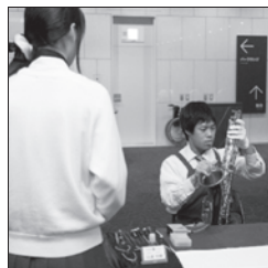
※昨年度記録写真より