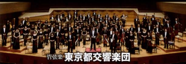
管弦楽 東京都交響楽団