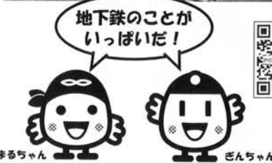
まるちゃん どんちゃん