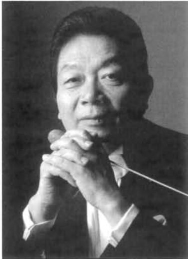
写真 第100回定期演奏会 2015年1月25日 於サントリーホール

東京大学の学生によって構成されるオーケストラ。1920年の発足以来、ベートーヴェン交響曲第4番の日本初演、マーラー交響曲第1番「巨人」の学生初演、ヨーロッパへの演奏旅行など多彩な演奏活動を続けてきた。また、NHK交響楽団の前身、新交響楽団の創立者である近衛秀磨氏、当団名誉指揮者である早川正昭氏など多数の音楽家を輩出している。現在は、三石精一氏を終身正指揮者として迎え、夏のサマーコンサートと冬の定期演奏会を活動の中心とする一方、学園祭での演奏会、小中学生を対象とした音楽教室など、さまざまな音楽活動を行っている。