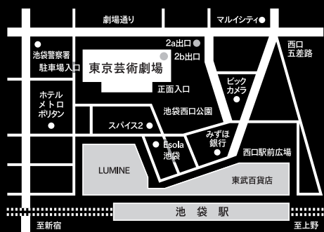
JR・東京メトロ・東武東上線・西池袋線 池袋駅西口地下通路2b出口直結

託児サービス | だっこルーム 03-3981-7003 (月~金 10:00~17:00)