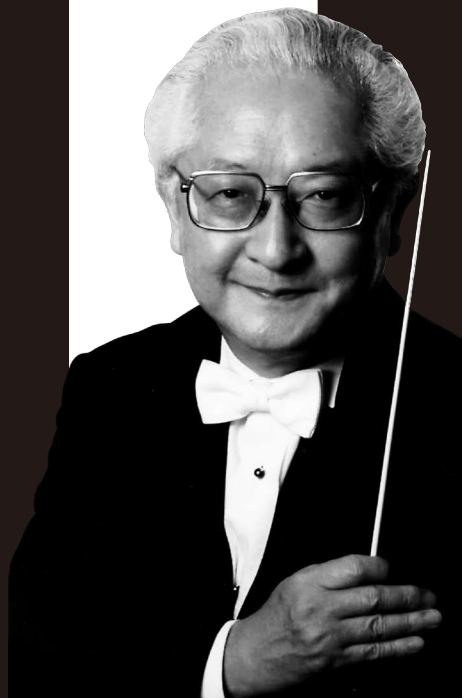
Conductor KAZUYOSHI AKIYAMA