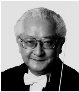
秋山和慶 (指揮) KAZUYOSHI AKIYAMA (Conductor)

1941年生まれ。アメリカ響音楽監督、バンクーバー響音楽監督(現在桂冠指揮者)、シラキュース響音楽監督、東京響音楽監督・常任指揮者、大阪フィル首席指揮者、札幌響首席指揮者/ミュージック・アドバイザーを歴任。これまでにサントリー音楽賞、芸術選奨文部大臣賞、大阪府民劇場賞、大阪芸術賞中国文化賞(広島)をはじめ、東京交響楽団とともに毎日芸術賞、京都音楽大賞、モビル音楽賞を受賞。2001年紫綬褒章、2011年旭日小綬章を受章。2014年度文化功労者に選出、また中国文化賞(広島)、徳島県表彰特別功労賞を受賞、2015年渡邊暁雄音楽基金特別賞を受賞。現在、東京交響楽団桂冠指揮者、広島交響楽団音楽監督/常任指揮者、九州交響楽団首席指揮者/ミュージック・アドバイザー、中部フィルハーモニー交響楽団アーティストック・ディレクター/プリンシパル・コンダクター、洗足学園音楽大学教授。