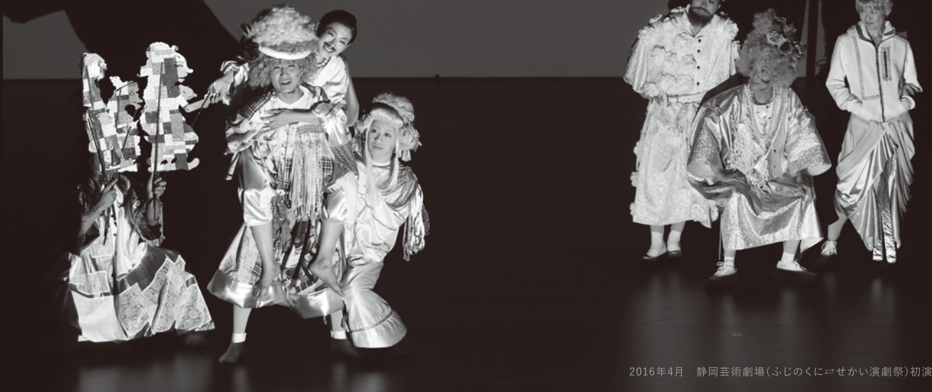
2016年4月 静岡芸術劇場(ふじのくに)に『せいかい演劇祭』初演

1990年に野田秀樹が自身の主宰する「夢の遊眠社」のために書き下ろし演出した「三代目、リチャード」。舞台は法廷、被告は「リチャード三世」、対する検事は「シェイクスピア」!シェイクスピアは、リチャード三世やヴェニス商人をなぜ徹底的に悪人として描いたのか——という疑問から生まれたこの戯曲に、世界的に活躍するシンガポールの演出家オン・ケンセンが挑みます。伝統/現代、男性/女性、人間/人形、光/影、アナログ/デジタルなど相対するさまざまな要素が渦巻く、濃密でエネルギッシュなアジア的カオスが、やがて少年たちの美しい夢へと昇華する——。