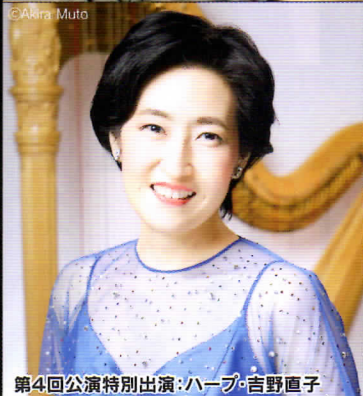
第4回公演特別出演：ハープ・吉野直子

人気、実力ともに日本を代表するピアニスト清水和音と、クラシックコンサートの司会に定評があるフリーアナウンサー八塩圭子の2人が、 2016年4月より東京芸術劇場コンサートホールを舞台に開催している人気公演!!