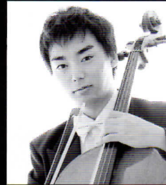
富岡 廉太郎 チェロ 東京シティ・フィル客員首席

東京芸大附属高校、東京芸大、ニューヨーク・ジュリアード音楽院出身。室内楽コンクールで優勝など多数。2004年N響入団、08年より首席奏者。