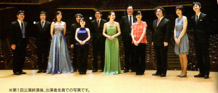
※第1回公演終了後、出演者全員での写真です。

日本を代表する名ピアニスト清水和音と、 N響首席奏者や日本音楽コンクール優勝者など、 気鋭の演奏家たちの豪華な競演!