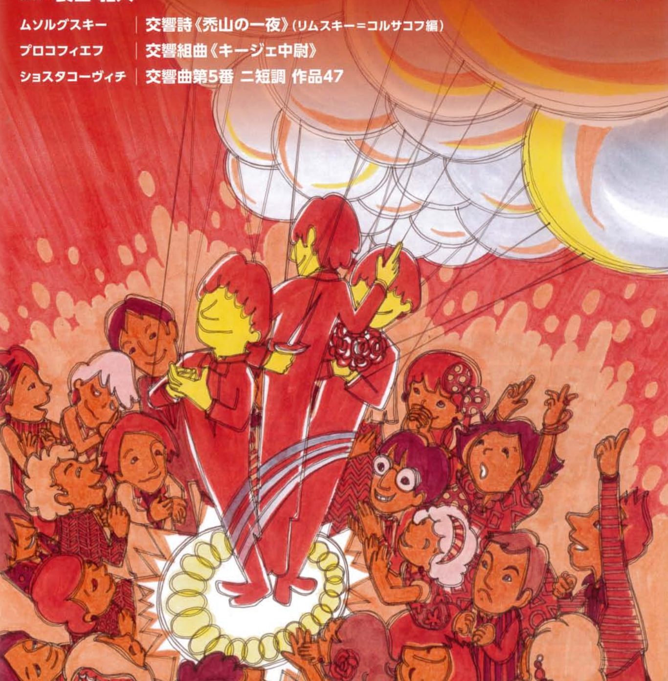
イラスト: 露木 茜

電子チケットぴあ ▶ 0570-02-9999 http://t.pia.co.jp/