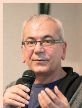
ガンナム・ガンナム

舞台はダーイシュ*の支配下にある架空の村。ここに住む夫婦ドウハー(朝)とライラックは芸術を若者に教えているが、学校は軍事拠点に、教え子たちは戦闘員となり、やがて死がふたりを引き裂く日がやってくる……。未来の子どもたちの幸せな日々を祈って書かれた、時空を往還する愛の物語。2016年に書かれ、ヨルダン文化省創造賞を受賞した本作は、今回のリーディング上演が世界初演となる。2018年3月、UAEで作家自身の演出により上演予定。