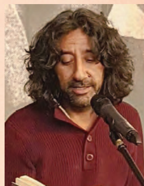
アドナーン・アルアウダ

娘の名はハイル(馬)、母の名はターイハ(さすらい)。ペドウィン族とクルドの間に生まれたハイルが因習と現代的生活のはざまに揺れながら成長し、女性として自立する姿を音楽と詩(アラビア語、クルド語)をふんだんに用いて描く語り物。多様性の中にシリアのアイデンティティを探る作家の真骨頂。2008年に出版され、2015年にはパレスチナのイエス・シアターによりアラブ演劇祭で初演されカーズミー賞を受賞した。