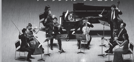
芸劇ランチコンサート第11回公演より