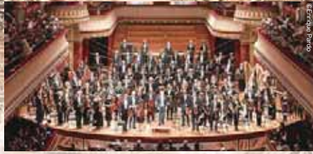
スイス・ロマン管弦楽団 Orchestre de la Suisse Romande

現在、スイス・ロマン管弦楽団の音楽/芸術監督。東京交響楽団の音楽監督も務めている。ルツェルン響、アンサンブル・アンテルコンタンポラン、バンベルク響の首席指揮者を歴任した。イギリス出身。ドイツの歌劇場で活動を始め、《ニーベルングの指環》全曲クルスなど、数々のオペラを指揮した。同時に現代音楽にも力を入れ、アンサンブル・モデルンともこの頃から共演。客演も多く、ベルリン・フィル、ウィーン・フィル、シカゴ響、コンサートヘボウ管などに招かれている。スイス・ロマン管とは、楽団創立100周年となる2018/19年シーズンを迎えるにあたり、南米やアジアへのツアー、R.シュトラウスやドビュッシー、リグティの作品を録音する。