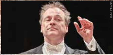
ジョナサン・ノット (指揮) Jonathan Nott, Conductor