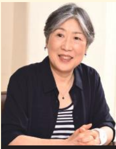
永井 愛 劇作家・演出家・二兎社主宰

日本を代表する劇作家であり、演出家として数々の名優と舞台を創ってきた二兎社主宰の永井愛による俳優のためのワークショップを3年ぶりに開催いたします。「セリフを言う＝相手にはたらきかけるためのアクション」という観点から演技をとらえ直す今回のワークショップでは、永井戯曲の中から“抜き差しならない状況”に