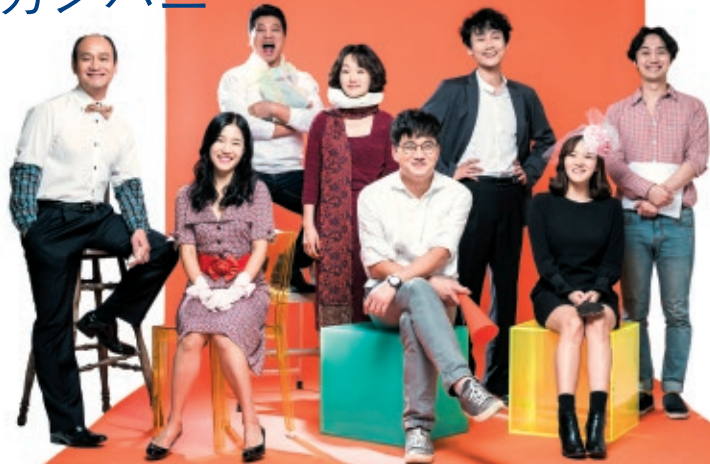
(韓国公演より)