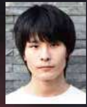
松井 社大 ACTOR / DANCER: MOMOKO MATSUI