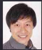
グランヴィル医師: ジョン・ハオ (バス) DOCTOR BREWIL: MAS EBARA