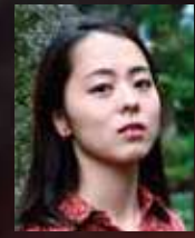
内藤 治水 ACTOR / DANCER: NAOKI NAITO