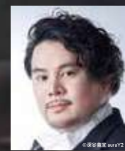
アルフレード: 宮里直樹 (テノール) ALFREDO: NAOKI MIZOGUCHI