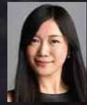
青木 萌 ACTOR / DANCER: MAS AOKI