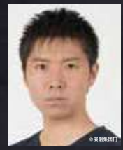
柳生 拓哉 ACTOR / DANCER: TAKUYA YABU