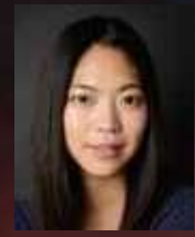
原田 理央 ACTOR / DANCER: YUKI NISHIDA