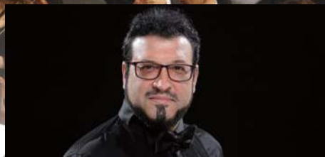
カメン・チャネフ (テノール) Kamen Chanef, Tenor

ブルガリア、ソフィアの著名な音楽一家に生まれる。祖父サーシャ・ポポフは、バイオリン奏者、指揮者でソフィアフィルハーモニー管弦楽団の創設者。母ヴァレリー・ポポフはスカラ座で定期的に歌っていたソプラノ。ブルガリア国立ソフィア音楽アカデミーでは母ヴァレリー・ポポフに師事。1987年ブッチーニ『椿姫』のヴィオレッタ役でデビュー。同年チェコのカルロヴァリで行われたドヴォルザーク国際声楽コンクールにて優勝。翌年スペインのビルバオ=ビスカヤ国際歌唱コンクール2位、1989年には、南アフリカのプレトリアでのUNISA国際音楽コンクールで優勝。1989年以来ウィーン、パリ、ベルリン、ニューヨーク、ローマ、ブリュッセル、ワシントン、ハンブルク、モスクワ、トリノ、ナポリなど世界中の歌劇場に登場している。レパートリーはバロックからワグナーにまで及び、特に「サロメ」、「ヴィオレッタ」などを主要レパートリーとしている。日本には、2015年ジョナサン・ノット指揮、東京交響楽団の定期公演に登場。2020年には新国立歌劇場に『サロメ』タイトルロールで登場予定。