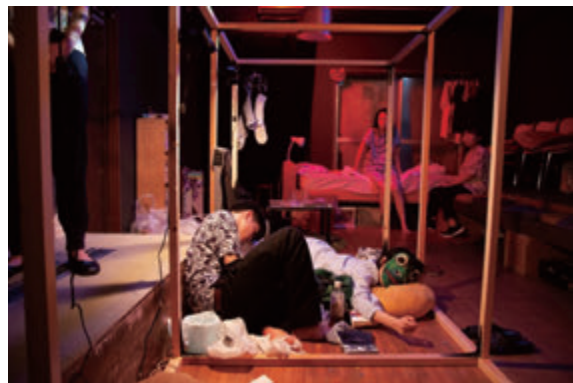
ウンゲツィーフア「自ら慰めて」(2018)