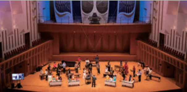
2020年のスペシャル・コンサートより

邦楽はもちろん前衛ジャズや現代音楽からロックまで幅広く活動するハイパー箏奏者。多くのジャズ・フェスティバルのステージに立ち、世界中の優れた即興家と共演を続けるかたわら、J-POPアーティストのコンサートや録音にも参加。英ワールドミュージック誌 Songlines の《世界の最も優れた演奏家50人》に選ばれている。