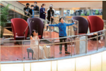
2020年のアトリウム・コンサートより