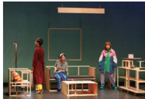
世界初演（Wiener Festwochen 2023）より