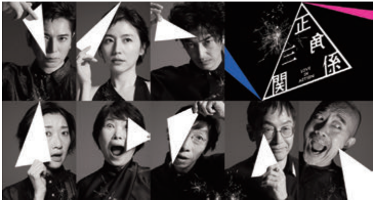
上段左から 松本潤 長澤まさみ 永山瑛太 下段左から 村岡希美 池谷のぶえ 小松和重 野田秀樹 竹中直人