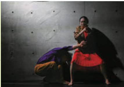
「花の名前」(再演2023年) 公演より