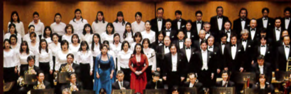
New National Theatre Chorus (Chorusmaster: Hirofumi Misawa)

主催:読売新聞社、日本テレビ放送網、読売テレビ、読売日本交響楽団 協賛:NTTコミュニケーションズ株式会社(12/19) 事業提携:東京芸術劇場(12/20)