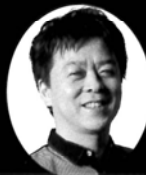
須川展也 © Masanori Doi