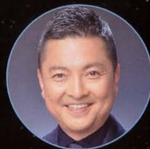
司会・ナレーション 朝岡 聡