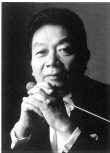
写真 第102回定期演奏会 2016年7月30日 於東京芸術劇場

東京大学の学生によって構成されるオーケストラ。1920年の発足以来、ベートーヴェン交響曲第4番の日本初演、マーラー交響曲第1番「巨人」の学生初演、ヨーロッパへの演奏旅行など多彩な演奏活動を続けてきた。また、NHK交響楽団の前身、新交響楽団の創立者である近衛秀麿氏、当団名誉指揮者である早川正昭氏など多数の音楽家を輩出している。現在は、三石精一氏を終身正指揮者として迎え、コンサートツアーと定期演奏会を活動の中心とする一方、学園祭での演奏会、小中学生を対象とした音楽教室など、さまざまな音楽活動を行っている。