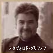
フセヴォロド・グリフノフ