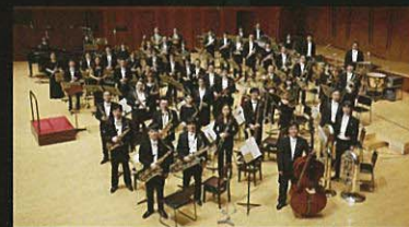
演奏: 東京佼成ウインドオーケストラ Tokyo Kosei Wind Orchestra