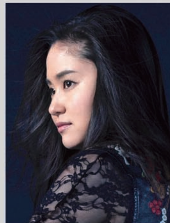
ヴァイオリニスト 庄司紗矢香

1981年より独自の創作活動を開始。1985年ダンスカンパニー KARAS 設立。世界の主要な芸術祭や劇場から招聘され毎年公演。独自のダンスメソッドを基礎に美術と音楽の稀有な才能によって創作を続ける。パリ・オペラ座を始めとした欧州の主要バレエ団に委嘱振付、エクサンプロヴァンスフェスティバル、ヴェニス・フェニーチェ劇場でのオペラ演出等、芸術表現の新たな可能性を開くアーティストとして創作依頼多数。2013年に活動拠点カラス・アパラタス開設。2020年4月に愛知県芸術劇場初の芸術監督に就任予定。2007年芸術選奨文部科学大臣賞、2009年紫綬褒章、2017年フランス芸術文化勲章オフィシエ他、受賞多数。