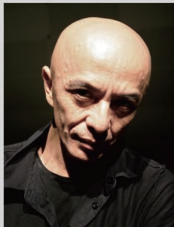
演出・振付・照明・美術・ダンス 勅使川原三郎