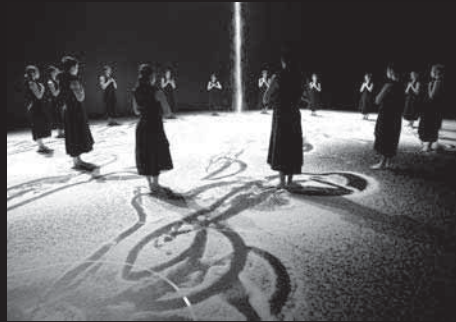
実験舞踊 vol.1 [R.O.O.M.]