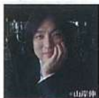
指揮 飯森 範親

リヒャルト・交響詩 シュトラウス「ティル・オイレンシュピーゲルの 愉快ないたずら」 ベルク ヴァイオリン協奏曲(ある天使の思い出に) リゲティ ポエム・サンフォニック(100台のメトロノームのための) ストラヴィンスキー バレエ音楽「春の祭典」(1967年版)