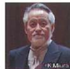
指揮 鈴木 秀美

C.P.E.バッハ 弦楽のためのシンフォニア 変ホ長調 Wq.182-2 ハイドン 交響曲第86番 二長調 ベートーヴェン 交響曲第1番 八長調 作品21