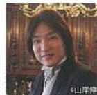
指揮 飯森 範親

ラヴェル 左手のためのピアノ協奏曲 ニ長調 ラヴェル ピアノ協奏曲 ト長調 ベルリオーズ 幻想交響曲 作品14