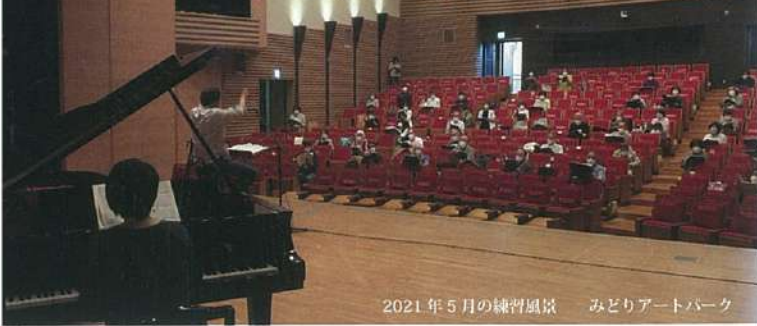
2021年5月の練習風景 みどりアートパーク