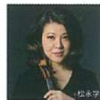
ヴァイオリン 竹澤 恭子