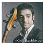
チェロ パブロ・フェランディス