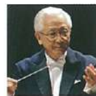
指揮 秋山 和慶

リスト 交響詩「レ・プレリュード」 ブラームス ヴァイオリン協奏曲 二長調 作品77 バルトーク 管弦楽のための協奏曲