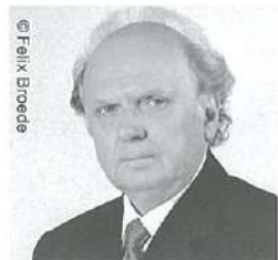
マレク・ヤノフスキ (指揮)

1939年生まれ、ポーランド出身のドイツの指揮者。伝統的なドイツ音楽の真髄を伝える巨匠の一人。欧米の一流オーケストラで傑出した評価を得ている。N響とは1985年の定期公演で初出演以来、定期的に共演を重ねているほか、東京・春・音楽祭のワーグナー・シリーズでは2014年から4年連続で《ニーベルングの指環》の指揮を務めた。