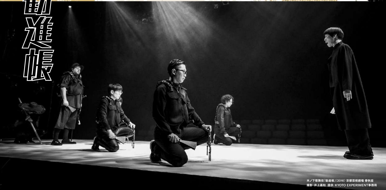
木ノ下歌舞伎『勸進帳』(2016) 京都芸術劇場 春秋座