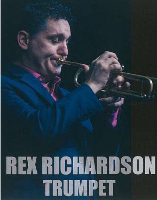
REX RICHARDSON TRUMPET

Super Virtuoso Series Vol.2 - Super! Jazz & Rock'n Night -