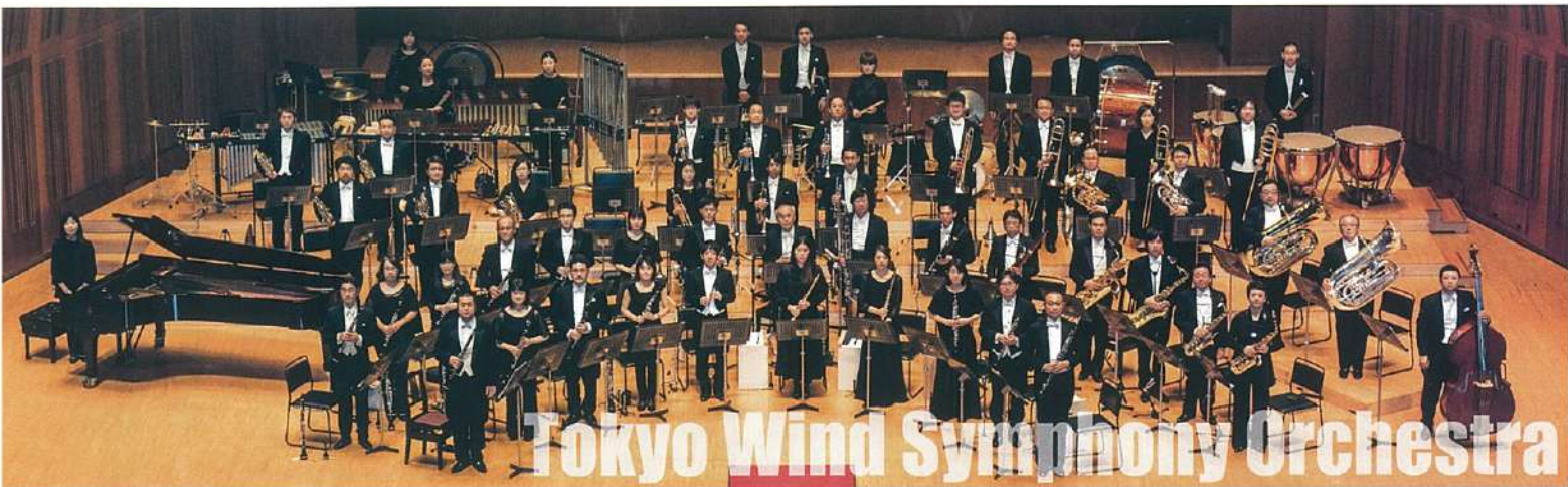
Tokyo Wind Symphony Orchestra

スクーティン・オン・ハードロック 3つの即興的ジャズ風舞曲/D.R. ホルジンガー