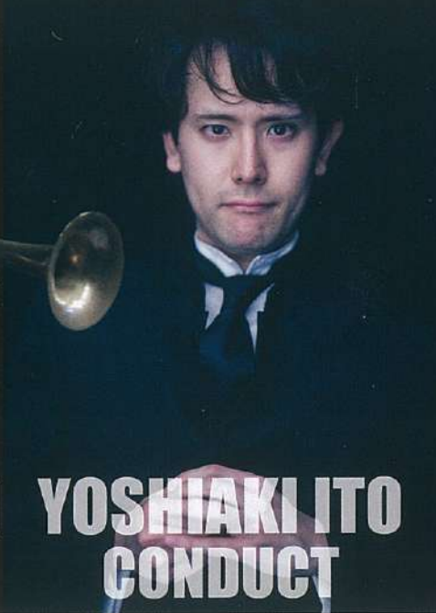
YOSHIAKI ITO CONDUCT