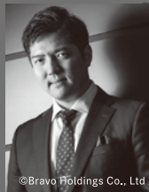
ファルケ博士 大西宇宙