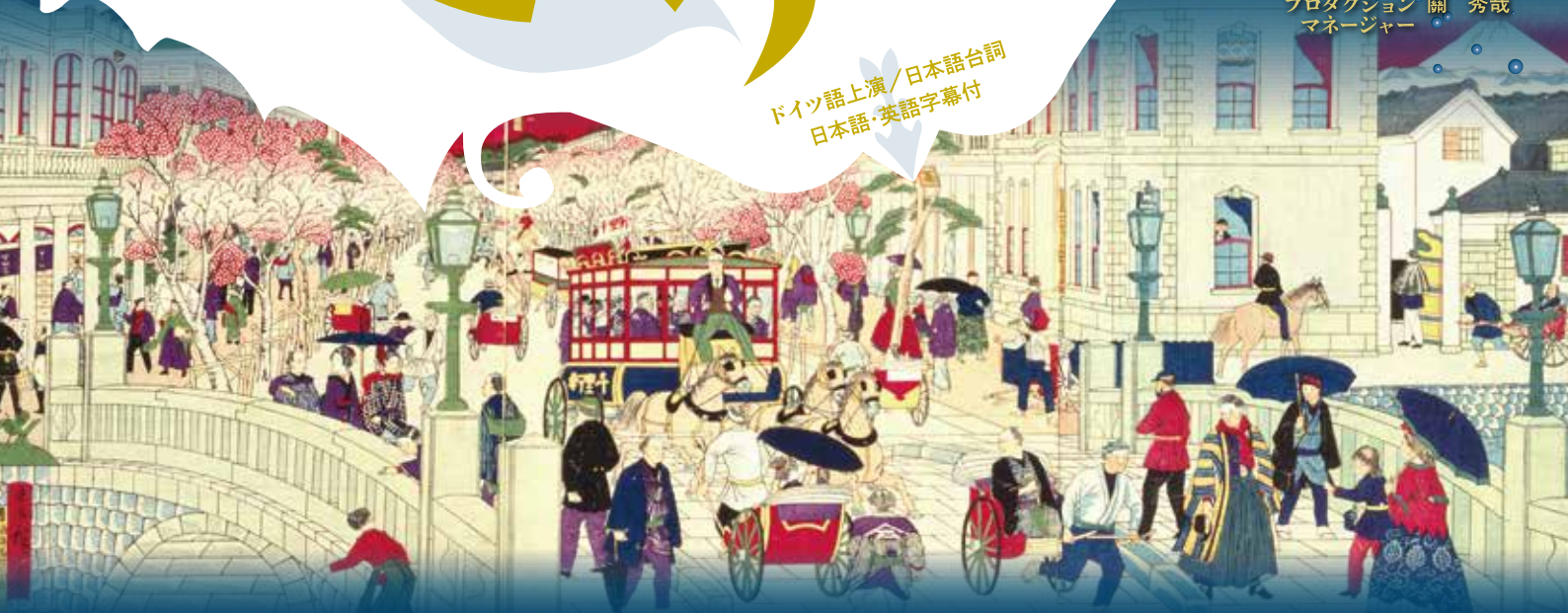
東京開化名勝京橋石造銀座通り両側陳化石商家盛栄之図 東京都江戸東京博物館所蔵

装置 松井るみ 衣裳 半田悦子 照明 杉本公亮 音響 石丸耕一 音響 酒井 健 舞台監督 関 秀哉 プロダクション マネージャー